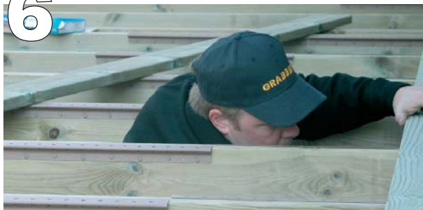
Där brädorna möts i skarv över en regel skall beslag fästas på bägge sidorna om regeln. Är det slumpmässigt skarvmönster kapas beslagen till brädans bredd och fästs på motsvarande sida av regeln där full-längdsbeslaget sitter.