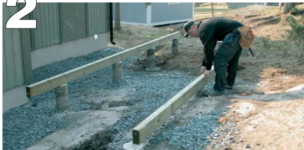
Utplacering av reglar.